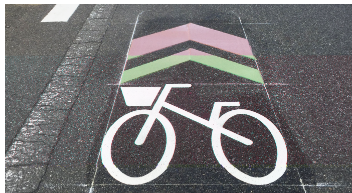
自転車走行推奨帯

そもそも「自転車共存都市」として本来あるべき姿とは、デメリットを大きくして半ば脅すような形で強制させるものではないのです。