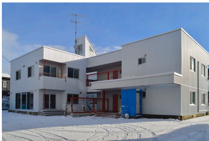
写真：エコアパートメント五日町

本プロジェクトは、SDGs に繋がる安全・安心な住まいの提供への取り組みとして、建物の長寿命化による組合員（オーナー）の経済的負担の軽減と、環境負荷低減を実現させることを目的にスタートしました。リノベーションによる物件維持管理の可能性を検証し、JA 山形市管理物件のこれからの賃貸事業モデルの構築を目指すとともに、対象物件が山形駅西口から徒歩 10 分程の好立地に位置することから、山形の街なかで豊かに暮らすライフスタイルの提案を目指しています。